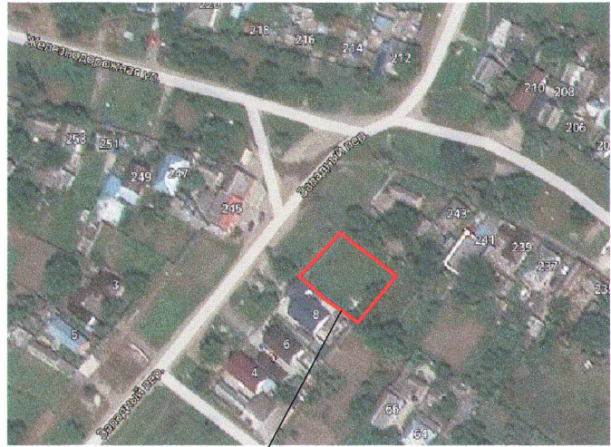
Участок проведения работ