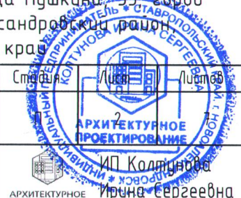
Схема планировочной организации земельного участка. М 1:500