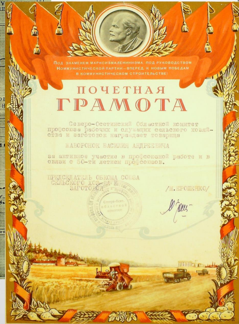
1957 год учеба в Моздокском элеваторном техникуме