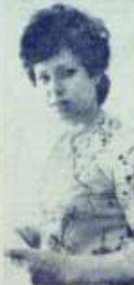
Сейчас, как никогда раньше в стране работают 17 дошкольных учреждений. Воспитанки детей в нас завоевали много золотых медалей.

Каждому из 76 детей, лишенных попечения родителей, отдел образования выплачивает ежемесячно пособие в сумме 257 000 рублей- дошкольникам, 340000 рублей- школьникам. Кроме того, нуждающимся выделяется разовое пособие на приобретение одежды, обуви, мягкого инвентаря. Среди опекаемых детей нет неуспевающих, нет правонарушителей.